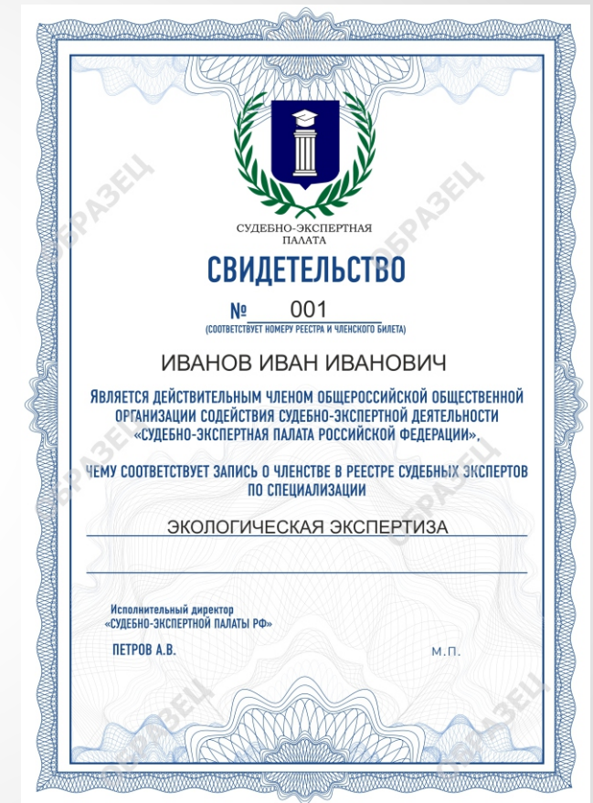
Бланк Свидетельства о Членстве СЭП РФ

ЧЛЕНСТВО В СЭП РФ ПОЗВОЛЯЕТ УЧАСТВОВАТЬ В МЕРОПРИЯТИЯХ ОРГАНИЗАЦИИ: КОНФЕРЕНЦИЯХ, ОБУЧАЮЩИХ СЕССИЯХ, ТРЕНИНГАХ, МЕТОДИЧЕСКИХ СОБРАНИЯХ, КУРСАХ ПОВЫШЕНИЯ КВАЛИФИКАЦИИ.