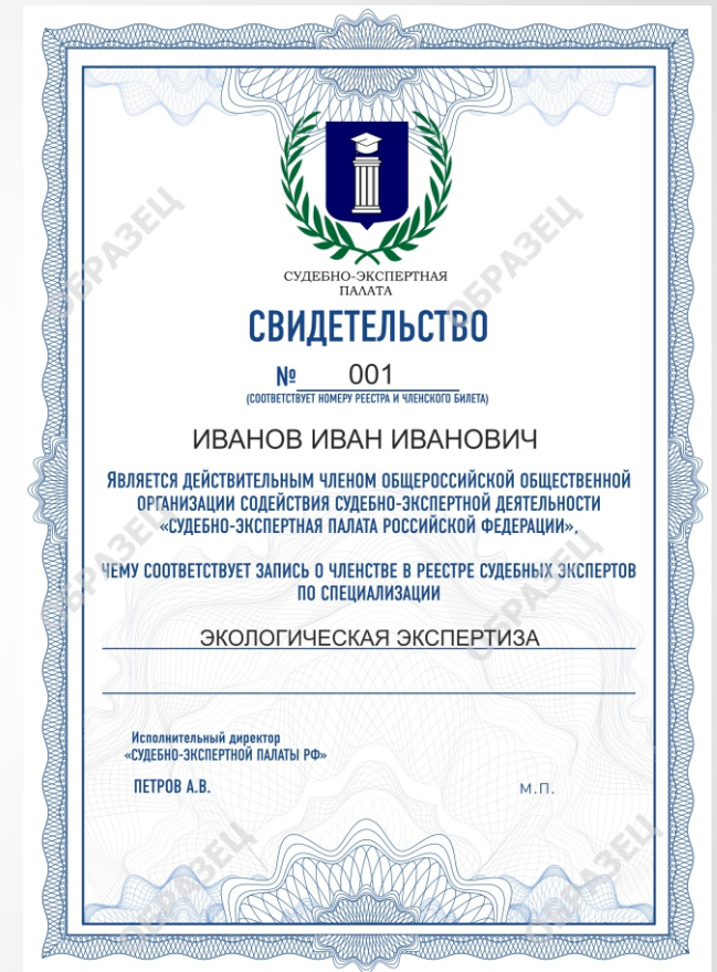
Бланк Свидетельства о Членстве СЭП РФ

ЧЛЕНСТВО В СЭП РФ ПОЗВОЛЯЕТ УЧАСТВОВАТЬ В МЕРОПРИЯТИЯХ ОРГАНИЗАЦИИ: КОНФЕРЕНЦИЯХ, ОБУЧАЮЩИХ СЕССИЯХ, ТРЕНИНГАХ, МЕТОДИЧЕСКИХ СОБРАНИЯХ, КУРСАХ ПОВЫШЕНИЯ КВАЛИФИКАЦИИ.