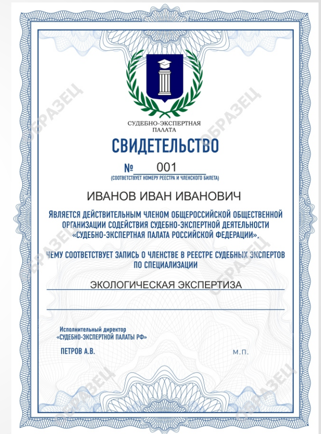
Бланк Свидетельства о Членстве СЭП РФ

ЧЛЕНСТВО В СЭП РФ ПОЗВОЛЯЕТ УЧАСТВОВАТЬ В МЕРОПРИЯТИЯХ ОРГАНИЗАЦИИ: КОНФЕРЕНЦИЯХ, ОБУЧАЮЩИХ СЕССИЯХ, ТРЕНИНГАХ, МЕТОДИЧЕСКИХ СОБРАНИЯХ, КУРСАХ ПОВЫШЕНИЯ КВАЛИФИКАЦИИ.