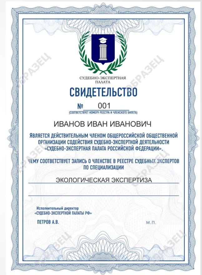
Бланк Свидетельства о Членстве СЭП РФ

ЧЛЕНСТВО В СЭП РФ ПОЗВОЛЯЕТ УЧАСТВОВАТЬ В МЕРОПРИЯТИЯХ ОРГАНИЗАЦИИ: КОНФЕРЕНЦИЯХ, ОБУЧАЮЩИХ СЕССИЯХ, ТРЕНИНГАХ, МЕТОДИЧЕСКИХ СОБРАНИЯХ, КУРСАХ ПОВЫШЕНИЯ КВАЛИФИКАЦИИ.