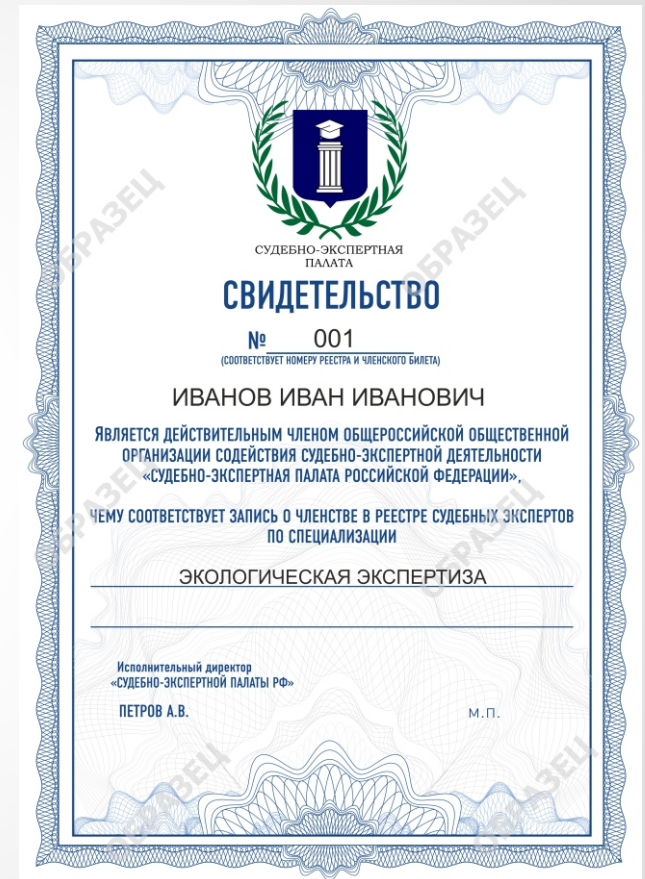
Бланк Свидетельства о Членстве СЭП РФ

ЧЛЕНСТВО В СЭП РФ ПОЗВОЛЯЕТ УЧАСТВОВАТЬ В МЕРОПРИЯТИЯХ ОРГАНИЗАЦИИ: КОНФЕРЕНЦИЯХ, ОБУЧАЮЩИХ СЕССИЯХ, ТРЕНИНГАХ, МЕТОДИЧЕСКИХ СОБРАНИЯХ, КУРСАХ ПОВЫШЕНИЯ КВАЛИФИКАЦИИ.